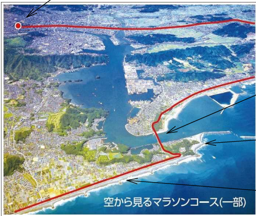
空から見るマラソンコース(一部)